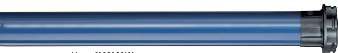
Moteur S&SO® RS100

Plus de valeur ajoutée pour les volets roulants